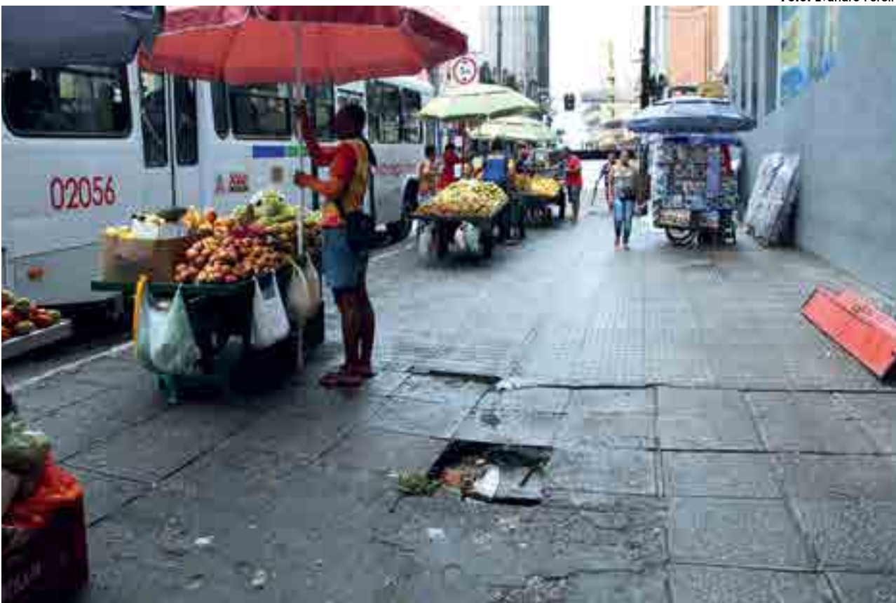
Calçadas danificadas e invasão de ambulantes, somadas ao período chuvoso, atormentam a vida dos pedestres na capital