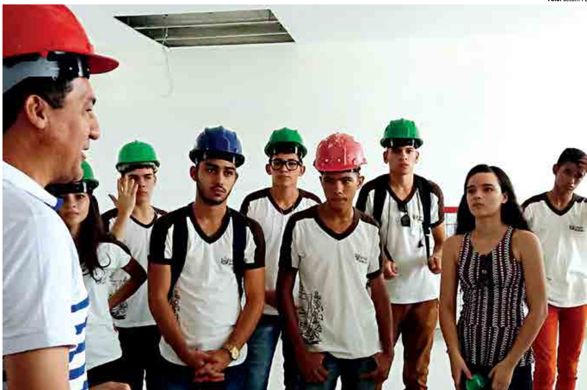
A Escola Cidadã Integral Técnica segue o mesmo modelo que a Escola Cidadã Integral, mas têm como diferencial os cursos técnicos, que visam à formação dos jovens para atuação no mercado de trabalho