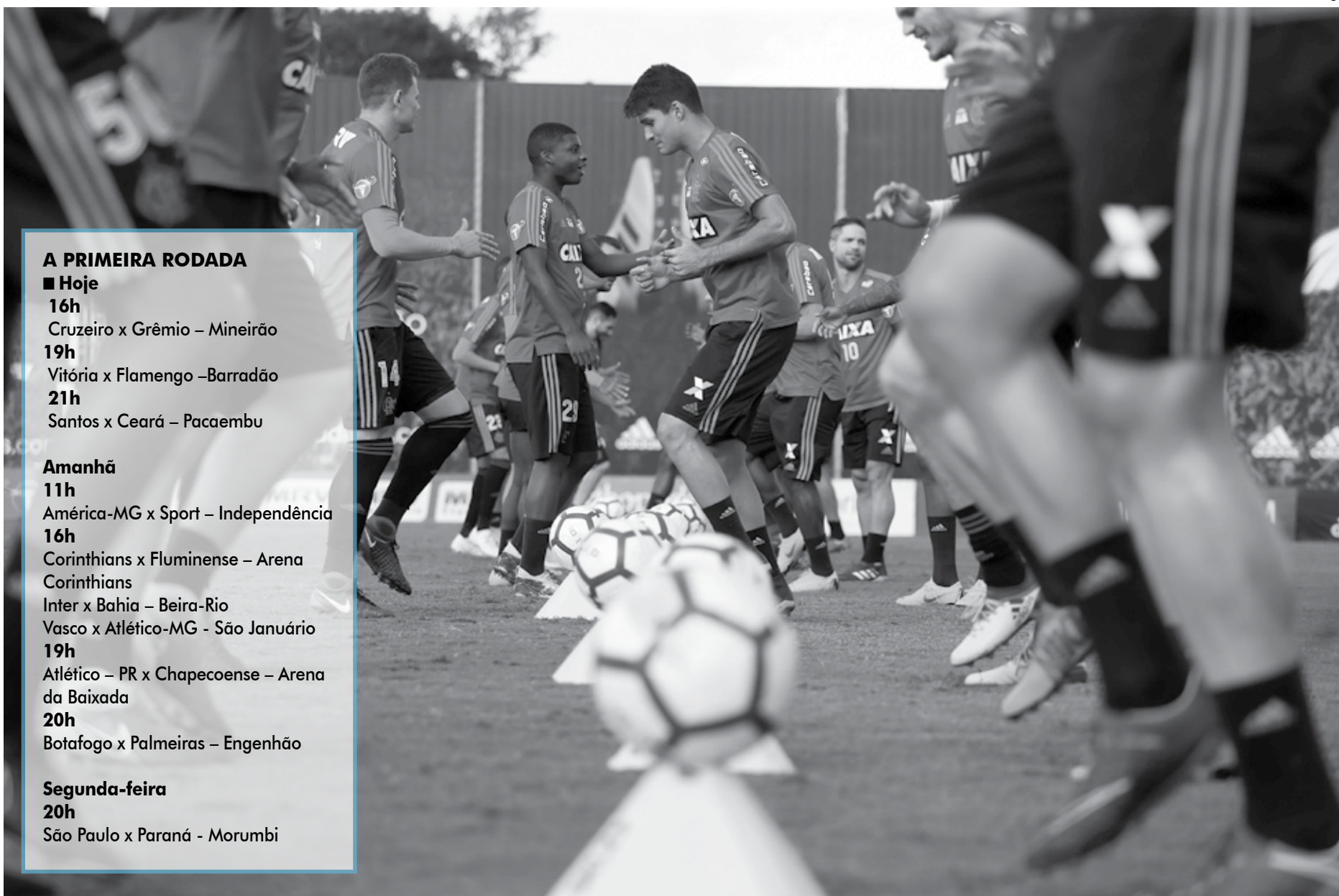
Jogadores do Flamengo treinando no Ninho do Urubu visando a estreia no Campeonato Brasileiro da Série A neste sábado diante do Vitória, no Barradão, em Salvador. Jogo será às 19 horas

Campeão da Libertadores do ano passado, o Grêmio, obviamente, não poderia ser deixado de fora da lista. A equipe começou o ano dando susto no Gaúcho, mas conquistou a