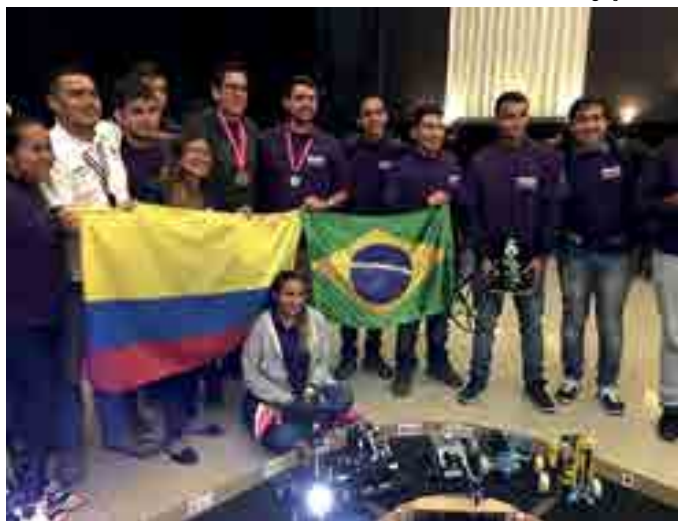
Equipes do IFPB participaram da Terceira Mercury Robotic Challenge Latinoamérica

A equipe da capital paraibana conquistou a segunda colocação no Desafio, que reuniu 40 equipes dos Estados Unidos, Brasil, Guatemala, México e Colômbia. "Esta foi, sem dúvida, a competição de maior nível de dificuldade que já participamos. Independentemente do resultado, foi um momento muito importante para nossa instituição que vem se destacando e alcançando prêmios internacionais. Em 2015, por exemplo, a GPCAR ficou em segundo lugar na versão americana